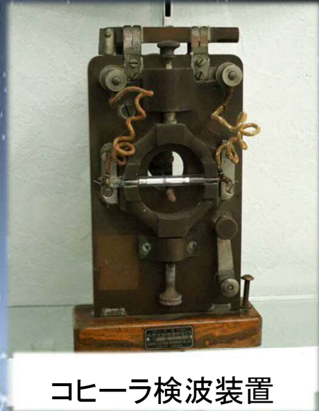
コヒーラ検波装置

電気通信技術の原点をたどり、未来につなぐ連続トークイベントが始まります。第1回は18世紀末から19世紀末にかけての電気通信黎明期の歴史をもっとも原始的な無線通信方式である火花放電とコヒーラ検波器の実演も交えて紹介。無線通信誕生の現場を体験することができます！